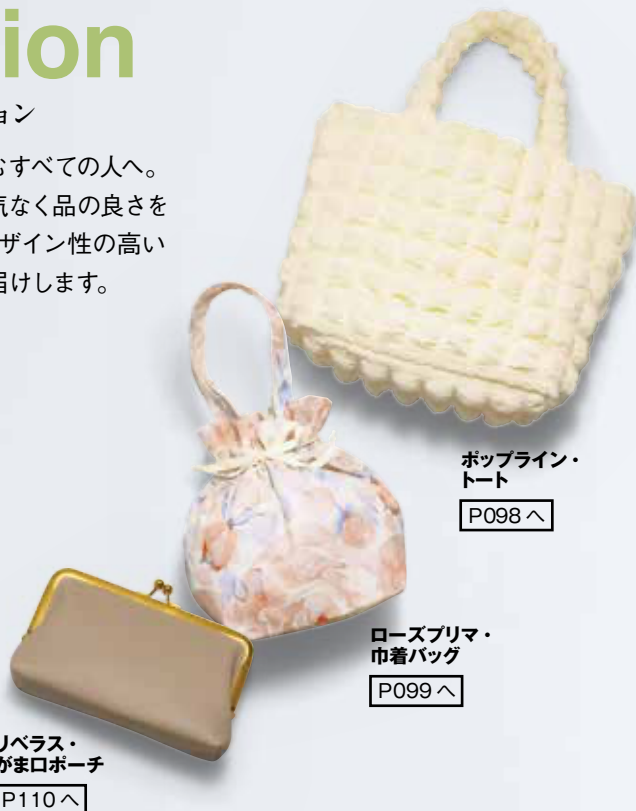
ポップライン・トート P098へ