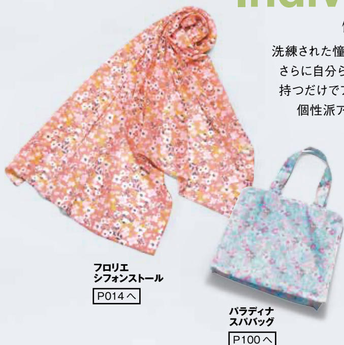
フロリエ シフォンストール P014へ

洗練された憧れのシンプルスタイルに さらに自分らしさをプラスするなら、 持つだけでアクセントになるような 個性派アイテムが最適です。